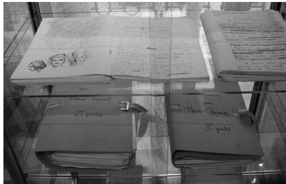
Le manuscrit d'Henri Troyat de son livre «Nicolas Gogol» à l'exposition au Centre russe à Paris.